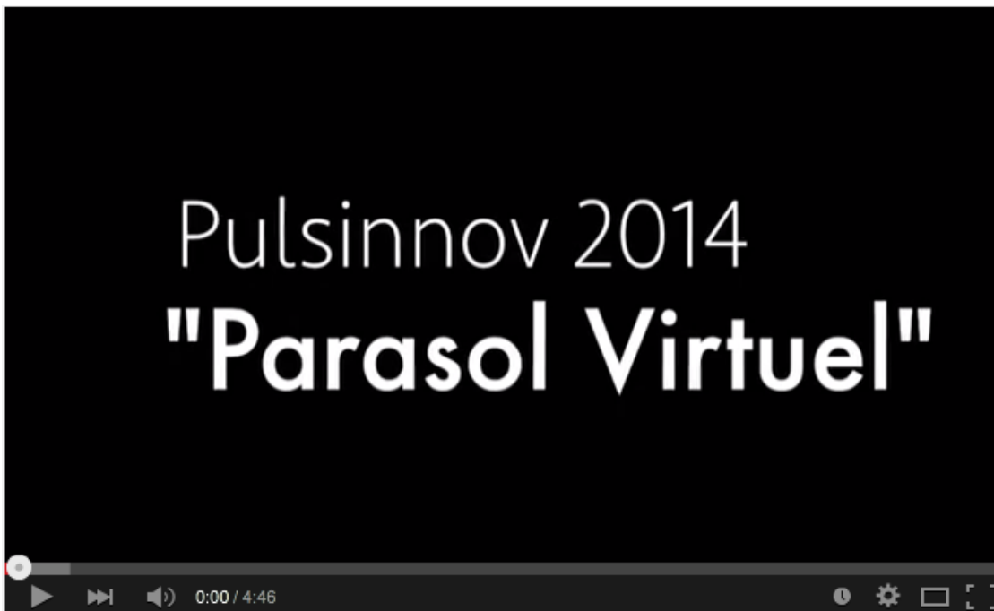
Vidéo de présentation du projet « Parasol virtuel » de Martial Jardel

Contact : Martial Jardel 06 33 21 90 83 – martialjardel@gmail.com